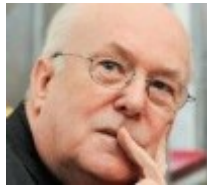
Cardinal Godfried Danneels

« Ces dix règles ne signifient rien si elles ne nous rapprochent pas de Dieu et des hommes. Ou si elles nous rendent tristes. Ce temps doit nous rendre plus légers et plus joyeux »