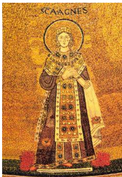
Sainte Agnès, Mosaïque de l'abside (7e siècle), Basilique Sainte-Agnès-hors-les-Murs

princesse Constantine, fille de l'empereur Constantin I, au-dessus des catacombes où fut enterré le corps de la jeune martyre.