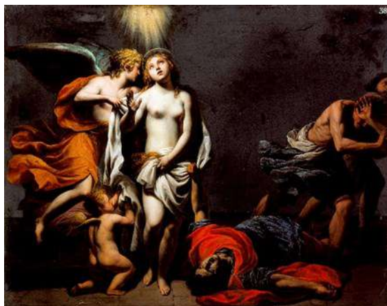
« Sainte Agnès protégée par un ange », peinture d'Alessandro Turchi, Los Angeles County Museum of Art

qu'une jeune romaine de treize ans n'hésita pas à sacrifier la vie terrestre qui s'ouvrait à elle, pour se donner à la vie du Dieu qu'elle adorait.