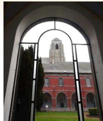
Le cloître fut fermé au début du XVIII e par des fenêtres en plein cintre

C'est au XVIII e siècle que l'on érigea la plupart des bâtiments qui font aujourd'hui la splendeur de Bonne-Espérance. Jean Patoul (1708-1724) effectua des aménagements dans le cloître (fenêtres en plein cintre) et reconstruisit la bibliothèque.