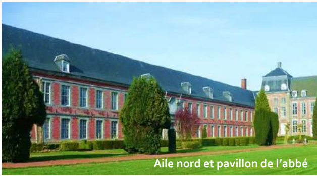
Aile nord et pavillon de l'abbé

Pendant qu'il achevait ces travaux, l'abbé Houzé préparait déjà la construction d'une