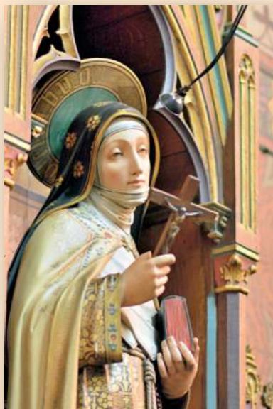
STATUE D'UN RETABLE DE L'ÉGLISE SAINTE COLETTE À GAND